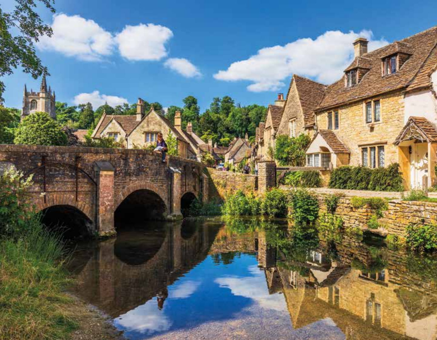
Bilderbuchatmosphäre in den Cotswolds