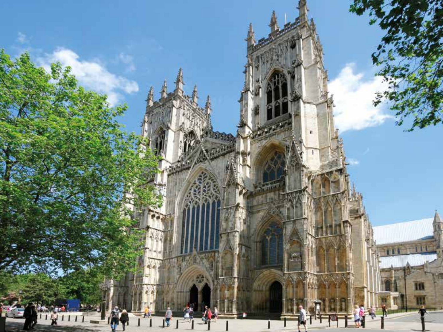
Die Kathedrale York Minster ist die zweitgrößte gotische Kathedrale Nordeuropas