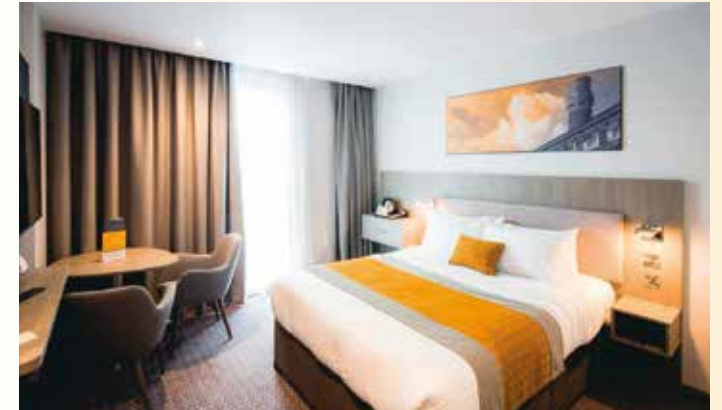
In warmen Tönen eingerichtete Zimmer