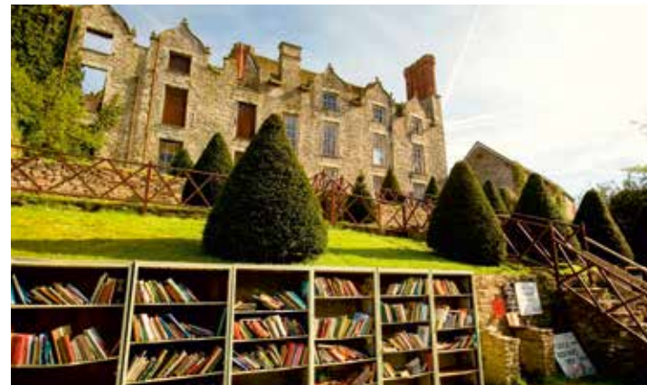
Ungewöhnlich: die Bücher-Stadtmauer von Hay-on-Wye