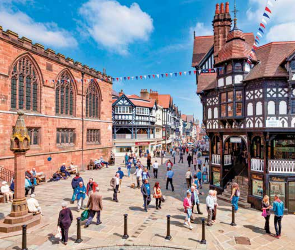
Die Arkaden Chester Rows sind das kulturelle Wahrzeichen der Stadt