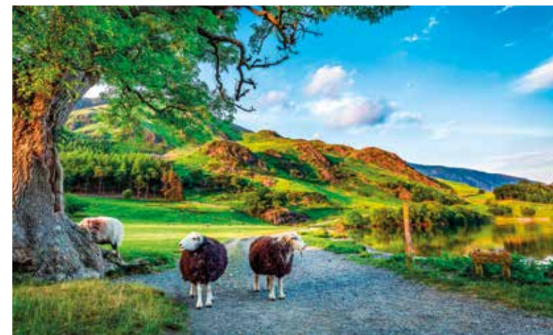
Der Lake District ist eine wildromantische Landschaft