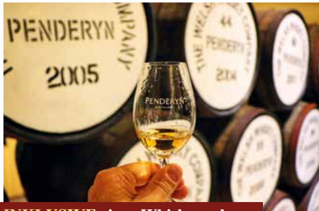
INKLUSIVE einer Whiskyprobe