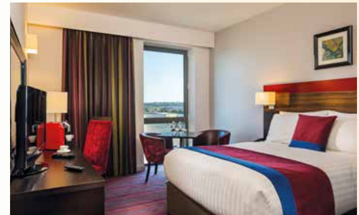
Komfortabel eingerichtete Zimmer