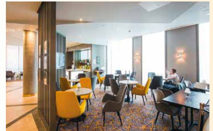
Das Hotel strahlt eine freundliche Atmosphäre aus