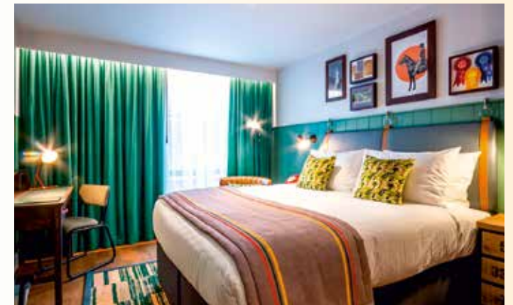
Gemütlich anmutende Zimmerausstattung