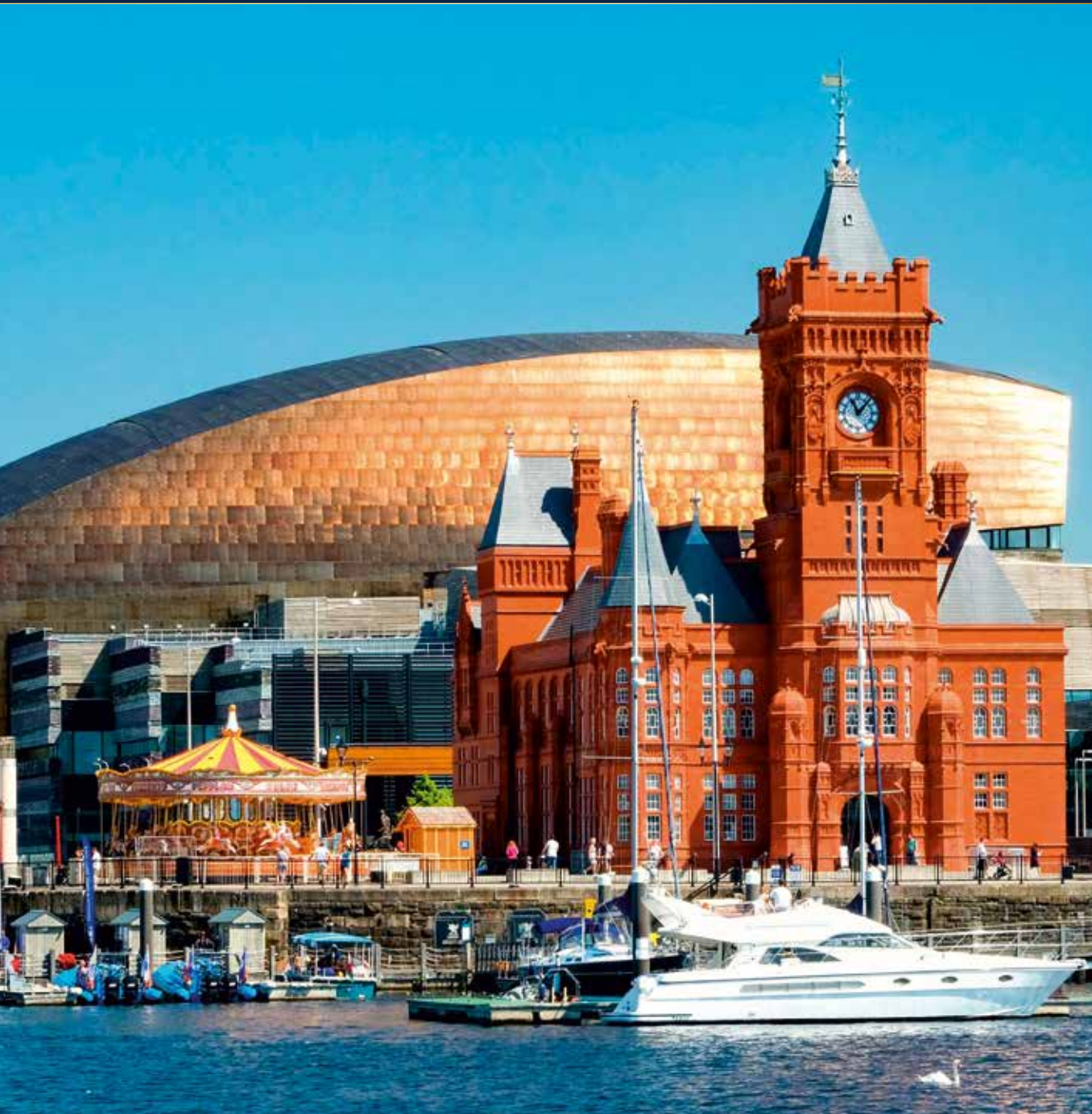
Cardiff Bay mit Blick auf das rote denkmalgeschützte Pierhead Building