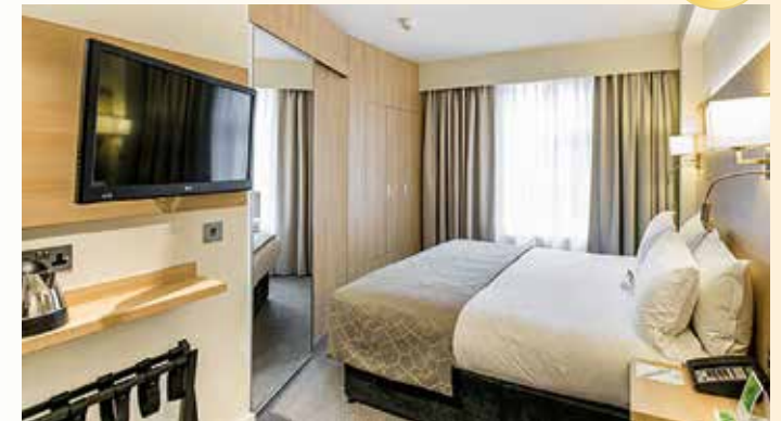
Es erwarten uns gemütliche Zimmer