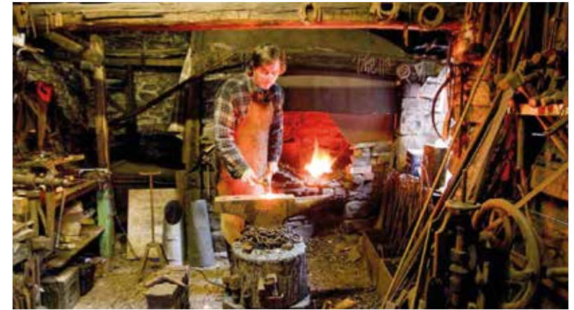
Besuch in der Museumswerkstatt