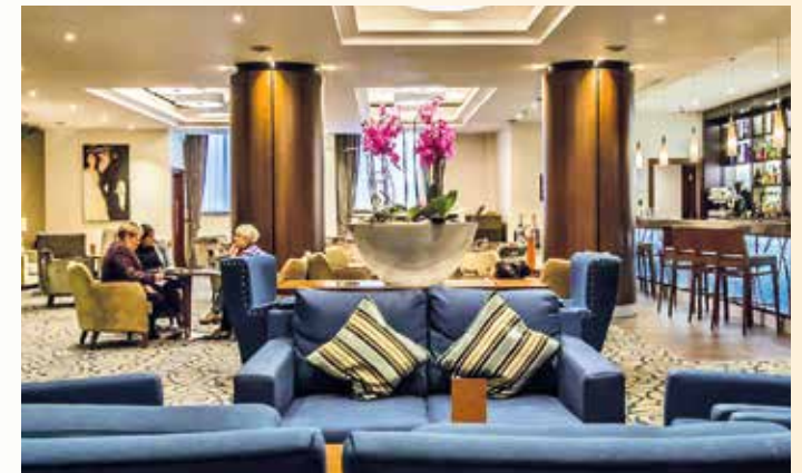
Stilvoll moderne Einrichtung