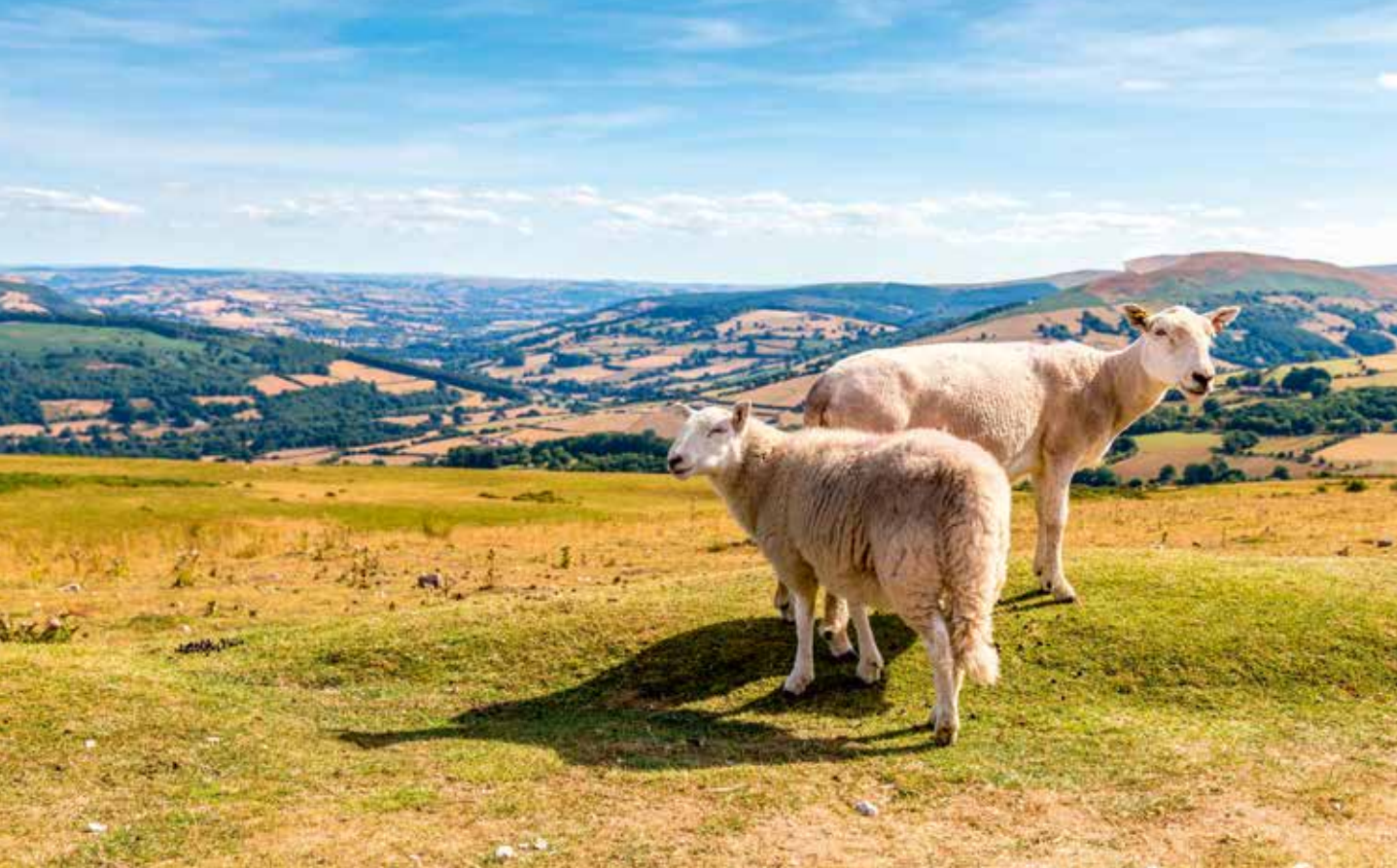
Der Brecon-Beacons-Nationalpark ist eine der naturverbundensten Regionen Großbritanniens