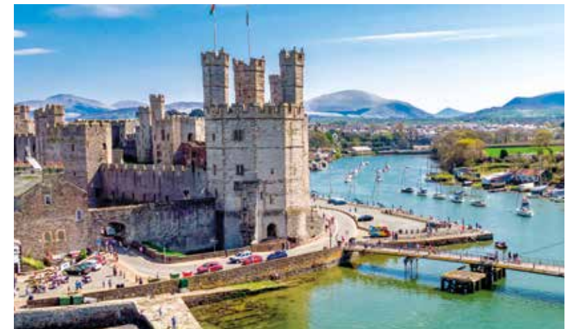
Caernarfon Castle – ein architektonischer Schatz in Wales

Über den Liverpoolsen Hafen wurden im 19. Jahrhundert 40 Prozent des Welthandels abgewickelt. Hier befand sich auch die Reederei der unglückseligen Titanic, nur eines der vielen Schiffe, auf dem von Liverpool aus Tausende Auswanderer ihr Glück in der neuen Welt anstrebten.