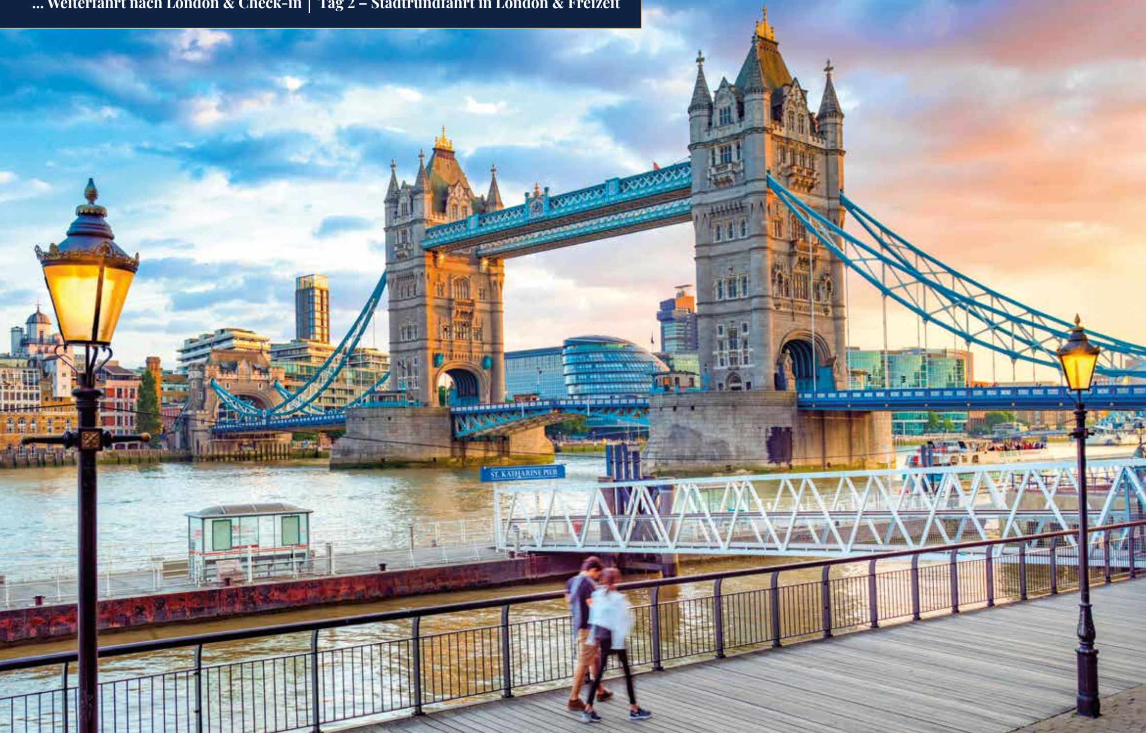
Die Tower Bridge ist wohl eine der schönsten Brücken der Welt