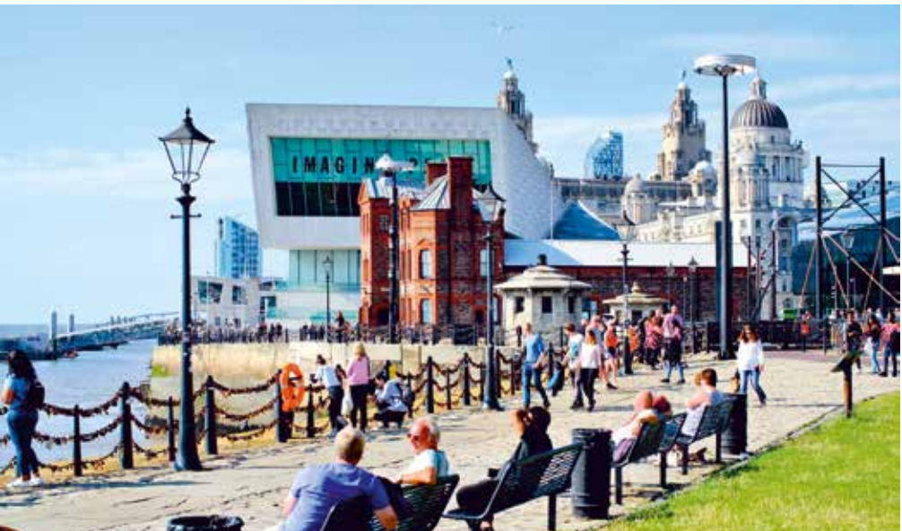
Das Hafenviertel in Liverpool zählt zum UNESCO-Weltkulturerbe