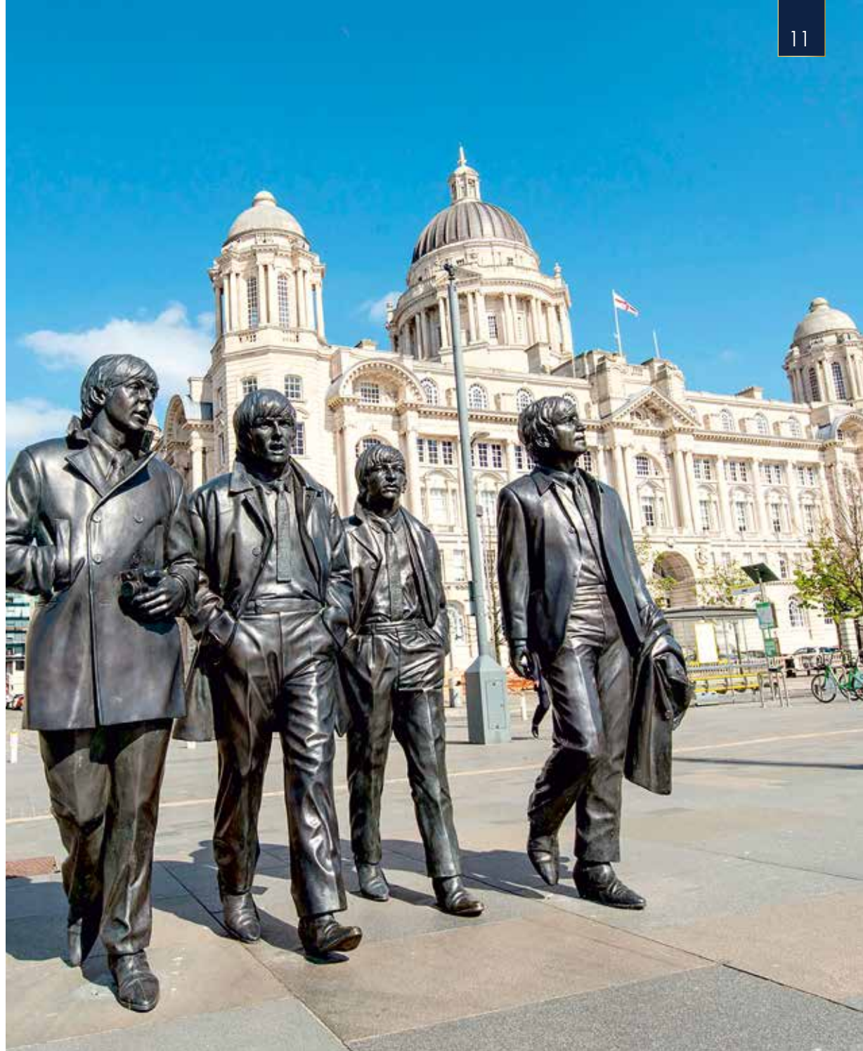
Ein beliebtes Fotomotiv: die Beatles-Statuen an der Waterfront Promenade in Liverpool