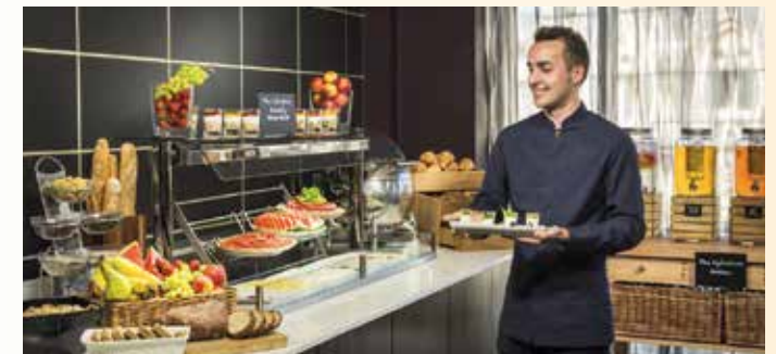
Wir bedienen uns am vielfältigen Frühstücksbuffet