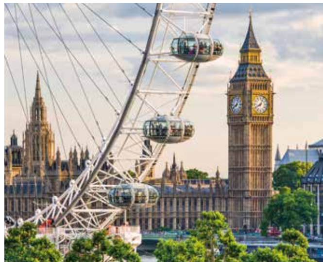
Riesenrad „London Eye“ mit Blick auf den Big Ben

Der Nachmittag steht Ihnen zur freien Verfügung: Spektakulär ist z. B. eine Fahrt mit dem Riesenrad „London Eye“ am Südufer der Themse. Aus 135 Metern Höhe überblickt man unter anderem die Tower Bridge, den Buckingham Palace und den Big Ben.