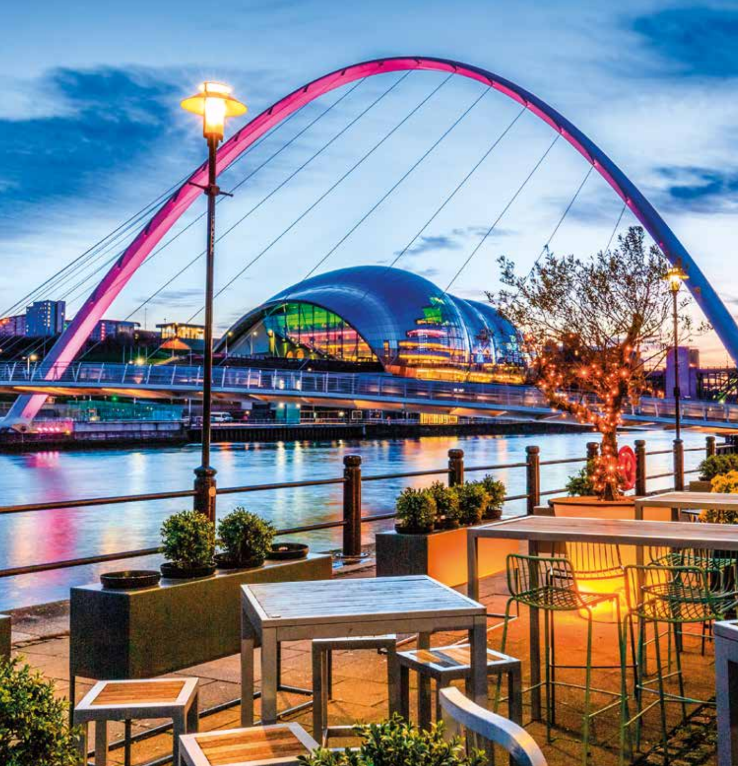
Gateshead Millennium Bridge: Die erste kippbare Brücke der Welt befindet sich in Newcastle upon Tyne