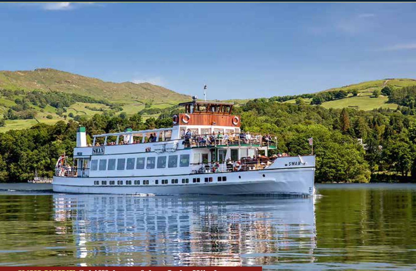
INKLUSIVE Schifffahrt auf dem Lake Windermere