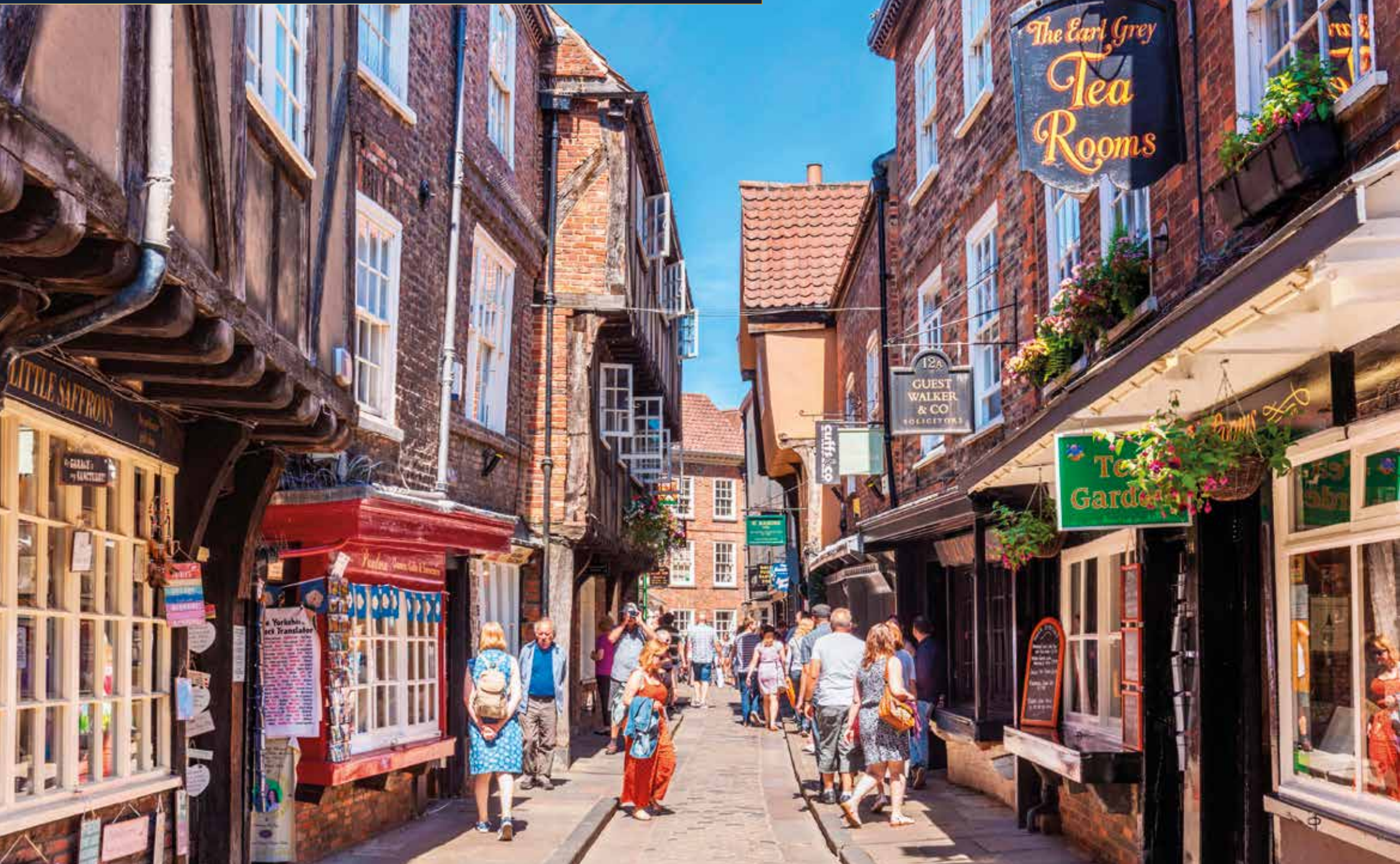
Es wird vermutet, dass die Gasse „The Shambles“ die meistbesuchte Straße in ganz Europa ist